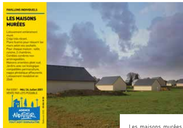
Les maisons murées

Le décalage humoristique au travers du regard d'un agent immobilier farfelu questionne la place future du bâti traditionnel, de l'étalement urbain et des friches industrielles.