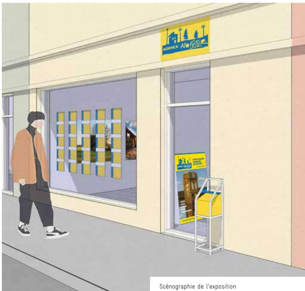
Scénographie de l'exposition