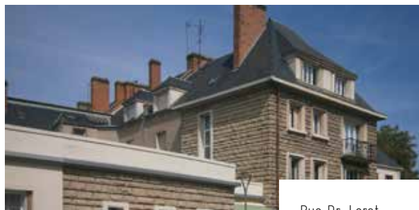
Rue Dr. Lerat