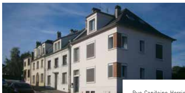
Rue Capitaine Herriot