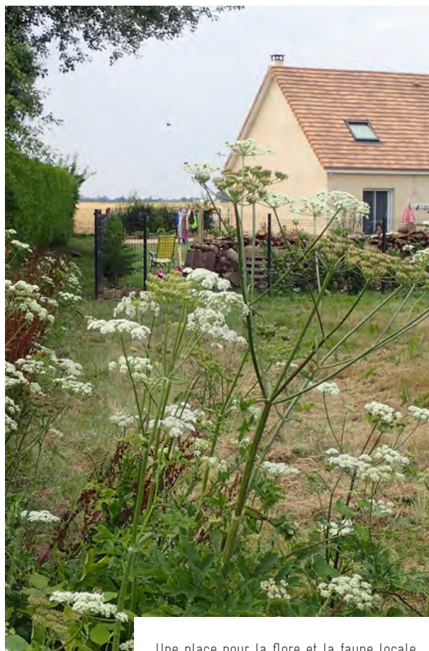
Une place pour la flore et la faune locale

L'aspect d'un espace vert laissant une large place à la flore sauvage peut dérouter les habitants habitués aux jardins traditionnels tondus et fleuris d'annuelles. L'information des futurs usagers de l'espace public, si possible dès la phase projet, permet d'éviter d'éventuelles incompréhensions. Les élus d'Aviron, engagés dans la démarche de labellisation Villes et Villages Fleuris, sont attentifs à informer les habitants sur ce mode de gestion. A Caugé, l'organisation régulière de journées citoyennes dédiées à l'entretien des chemins de promenade constitue l'occasion d'une sensibilisation plus globale à l'intérêt collectif de s'engager en faveur de la biodiversité locale.