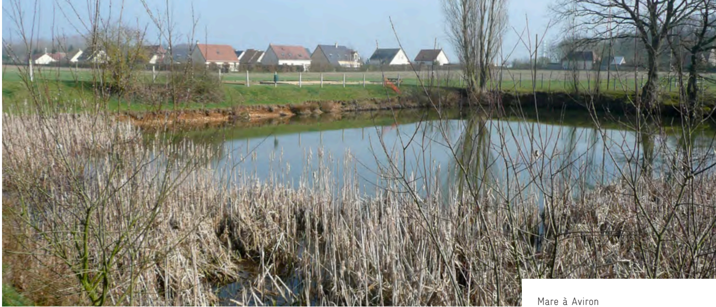
Mare à Aviron