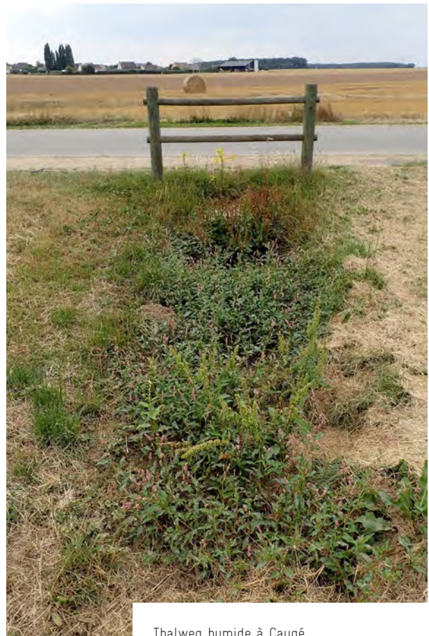
Thalweg humide à Caugé

Les emprises de projet d'Aviron et de Caugé sont très favorables à la préservation des espèces et de leur habitat. Leurs implantations en limite de hameaux, la présence de zones humides, mêmes modestes, et la proximité de boisements en font des sites refuges fonctionnels pour la faune et la flore locale. Cette préoccupation s'exprime à Aviron par la volonté des élus de privilégier une flore locale lors des prochaines campagnes de plantation. A Caugé, la présence d'un boisement classé en espace boisé classé (EBC) est perçue comme une valeur ajoutée paysagère significative.