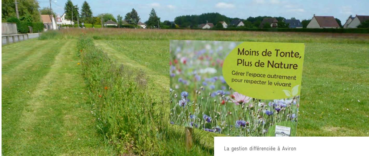
La gestion différenciée à Aviron