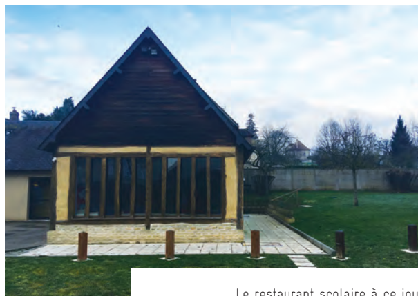
Le restaurant scolaire à ce jour