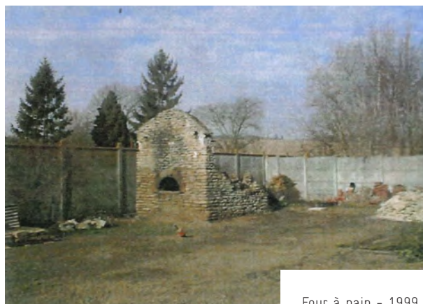
Four à pain - 1999

Une grande maison en maçonnerie de moellon (grouettes) a été réhabilitée en deux logements loués par la commune. Ceux-ci sont associés à un petit jardin. La location de ces logements, réalisés sans emprunt, permet une rentrée d'argent régulière pour la commune.