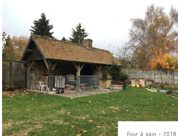
Four à pain - 2018