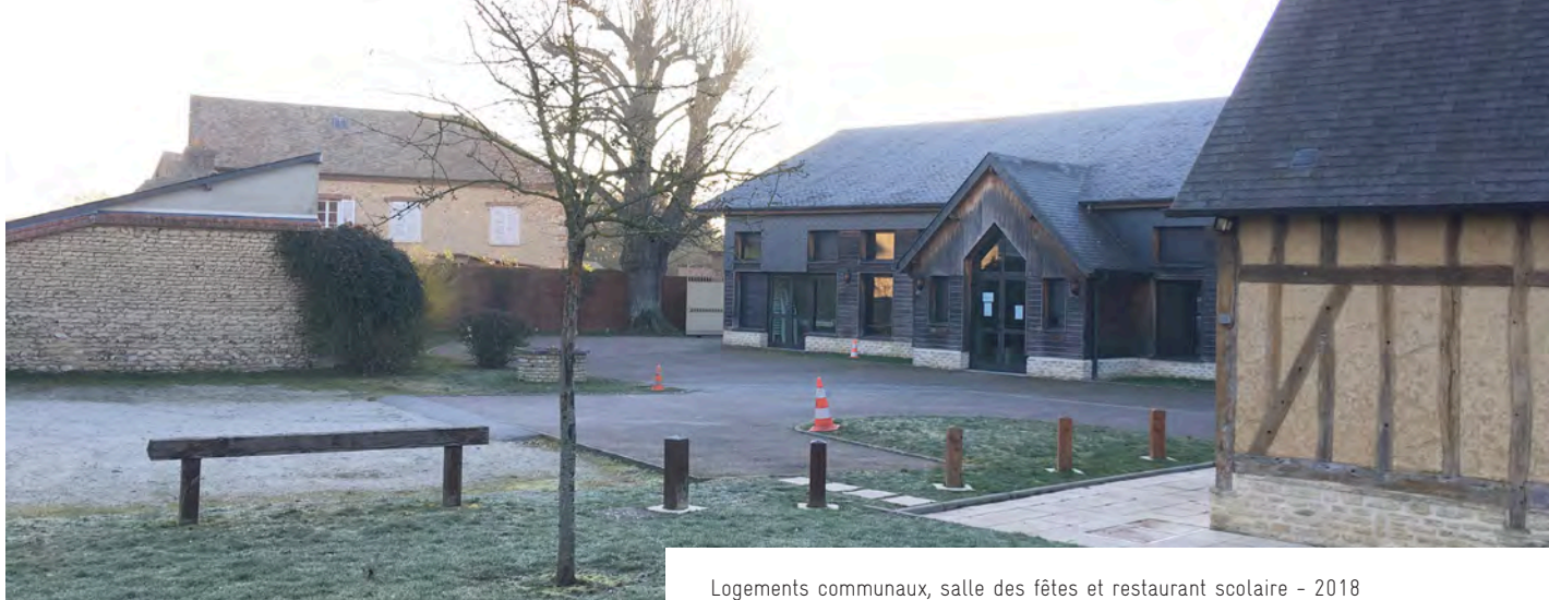
Logements communaux, salle des fêtes et restaurant scolaire - 2018