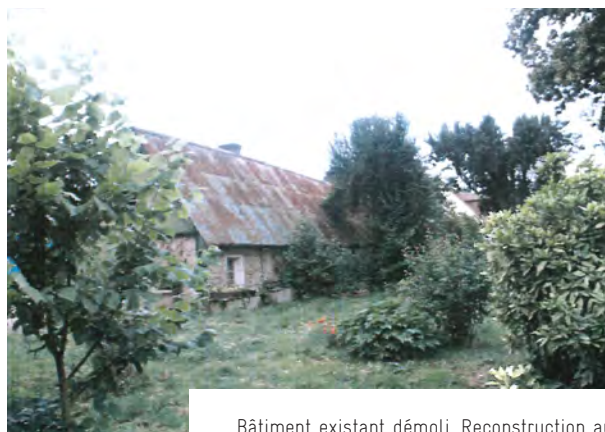
Bâtiment existant démoli. Reconstruction au même endroit du restaurant scolaire - 2002