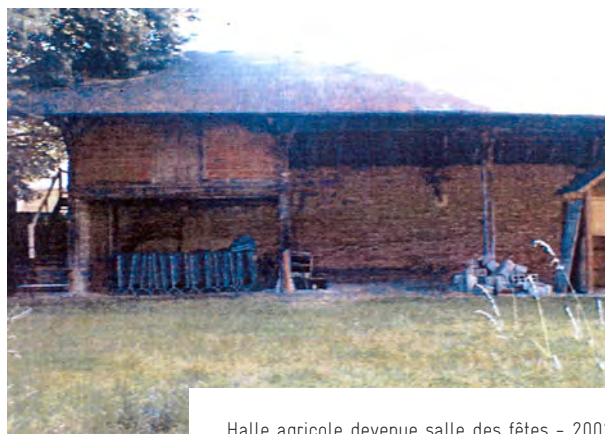
Halle agricole devenue salle des fêtes - 2002