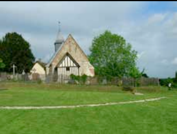
La nouvelle mairie adossée à la porterie médiévale