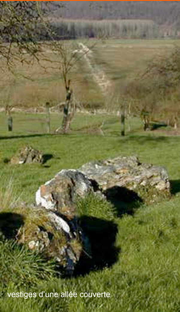
vestiges d'une allée couverte