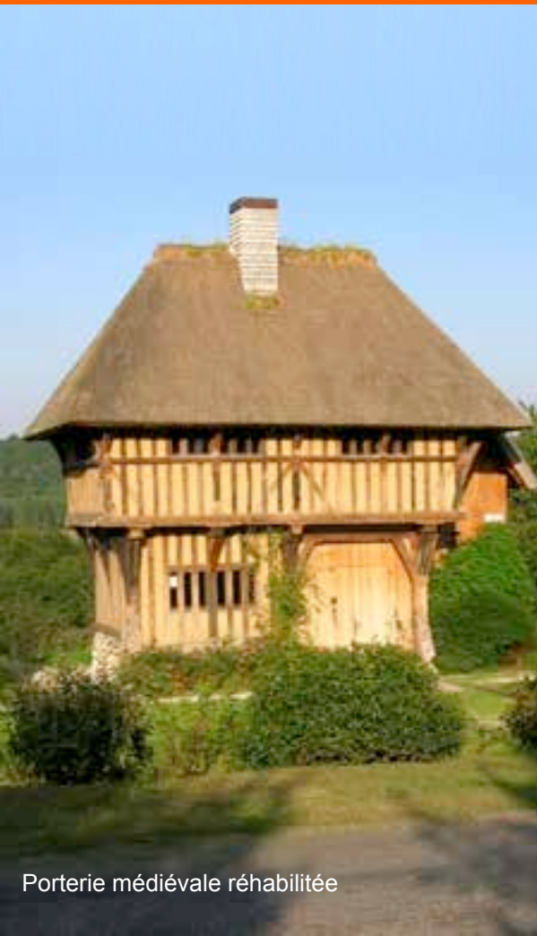
Porterie médiévale réhabilitée

L'exemplarité de l'action communale a favorisé des financements croisés et un taux de financement proche de 80 % (Etat dont DRAC, Conseil régional, Conseil général, fonds européens, SIEGE ...).